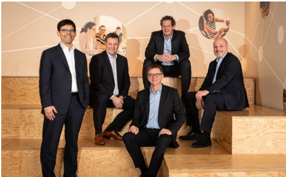
Zarząd Mercateo